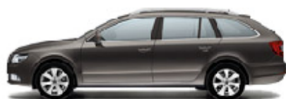
Hnědá Mocca metalíza