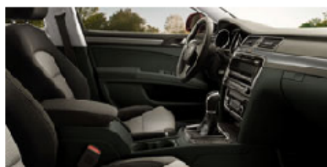
Rubicon šedá látka

ID konfigurace: 3T52L5, 2010, BU, 6Q6Q, MLSE9VJ, MSSH4KF, GPLCPLC, MEDW7AL, MSZUONM, GPJ2PJ2, GPSWPSW, GYGOYGO, GPT3PT3, GRABRAB, GPJAPJA, MEPH7X2, MZFM0TR, GPK5PK5, dokončená konfigurace, 26. února 2010 8:33